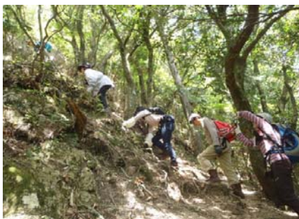
忍者岳登山のようす ②