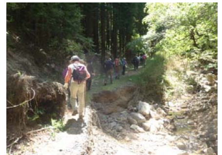
忍者岳登山のようす ①