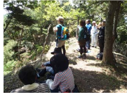
忍者岳登山のようす ③