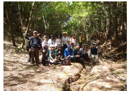
忍者岳登山のようす ④