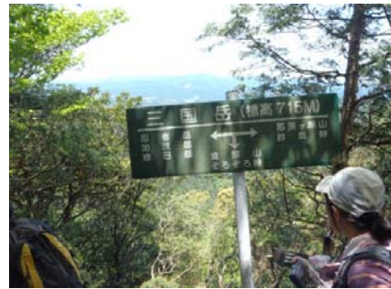
忍者岳からの景色 ②