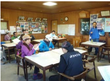
活動前のミーティング