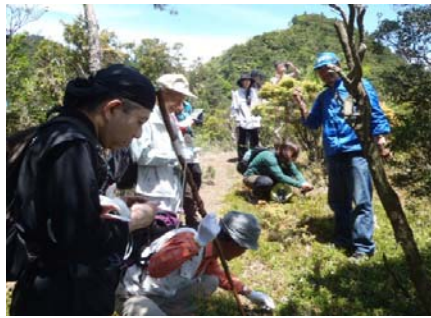
薬草観察のようす