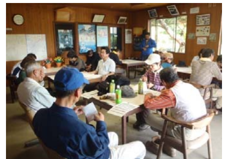
活動後の意見交換会