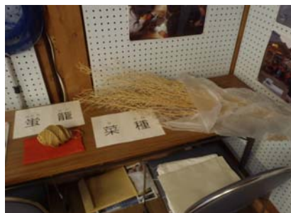
中蔵ギャラリーでの展示 ②