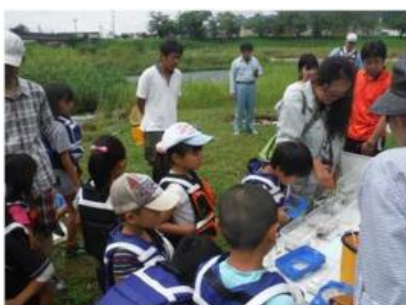
名張川で見つけた魚の観察 ①