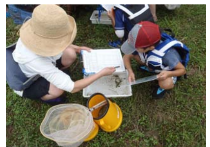
水生生物の同定と観察