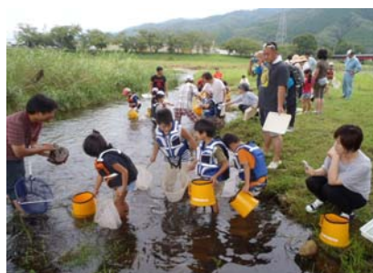
新町橋下での水生生物調査