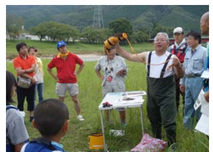
川遊びをするときの救命用具の説明