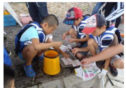
パケットテストでの水質観察 ①