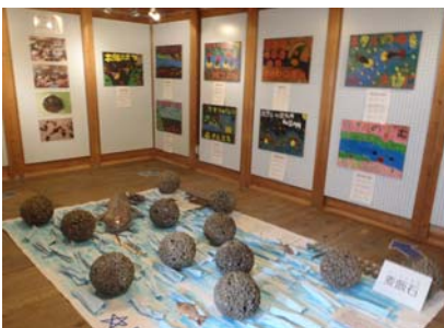
中蔵ギャラリーでの展示 ①