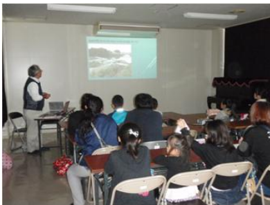
高岩井堰とやなせ水路の説明