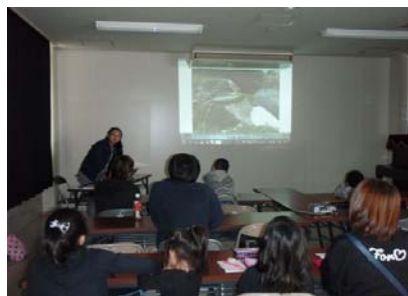
魚道改良工事に関する説明