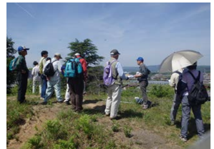
美旗新田用水散策の説明①