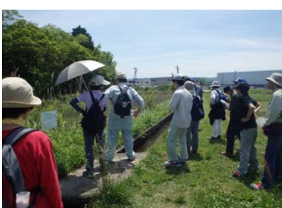
美旗新田用水散策の様子①