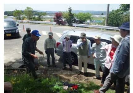
美旗新田用水散策の説明③