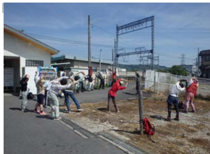
活動前の準備運動