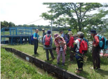
美旗新田用水散策の説明④