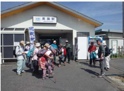
活動前のミーティング