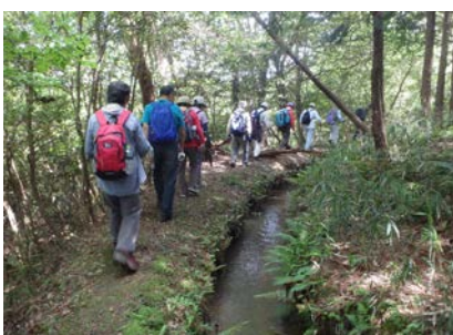
美旗新田用水散策の様子②