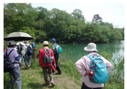
美旗新田用水散策の様子③