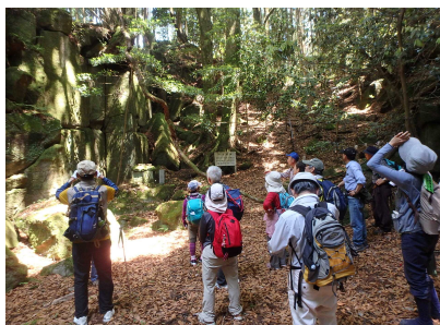
藤原千方伝説遺跡の説明