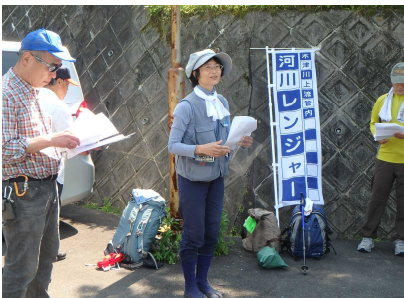
活動前のミーティング