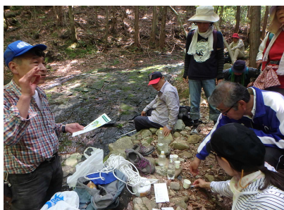
簡易水質調査のようす