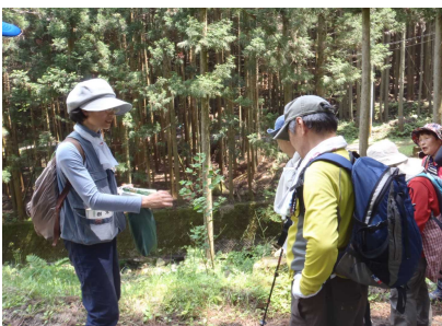
植物観察のようす①