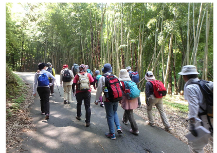
千方古道ウォーキング