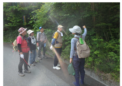
植物観察のようす②