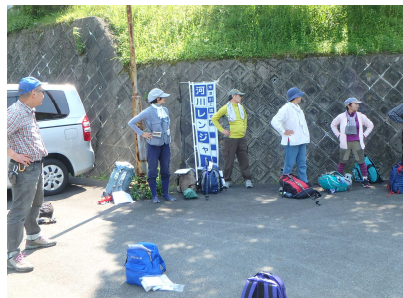
活動前の準備運動