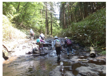
リバートレッキングのようす①