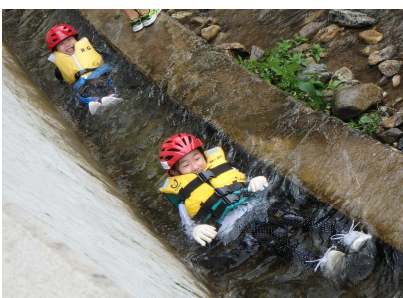
リバートレッキングのようす②