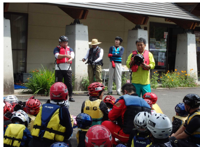
活動前のミーティング②