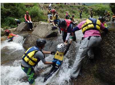
リバートレッキングのようす⑤