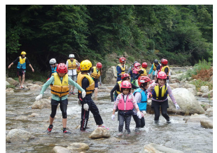
リバートレッキングのようす④