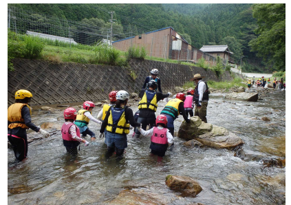
リバートレッキングのようす①