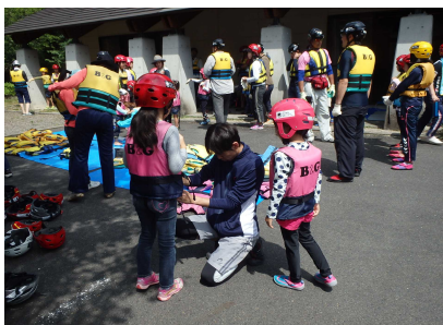
活動前のミーティング①