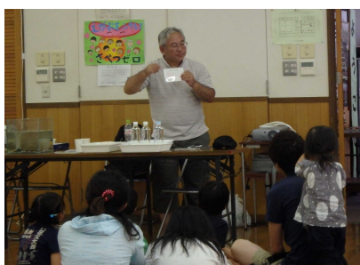
水生生物・水質調査の学習会①