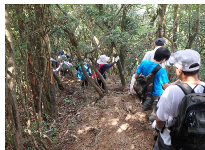
忍者岳登山のようす③