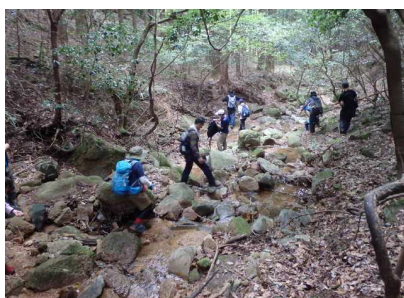
忍者岳登山のようす①