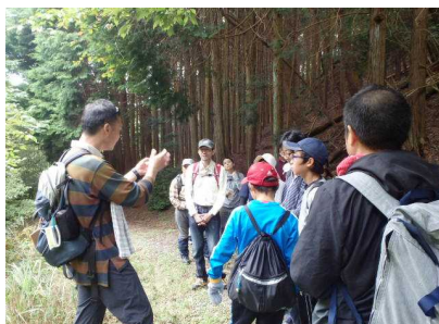
薬草観察のようす①