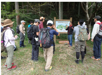
活動前のミーティング