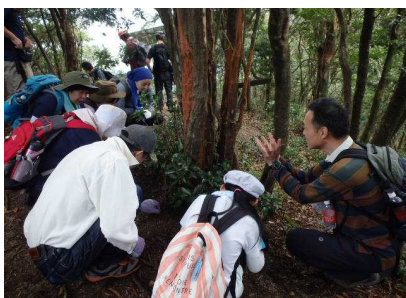
薬草観察のようす④