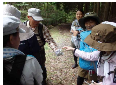
薬草観察のようす②