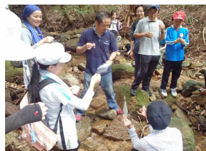
簡易水質調査のようす