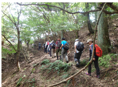
忍者岳登山のようす②