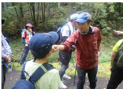
薬草植物観察のようす③