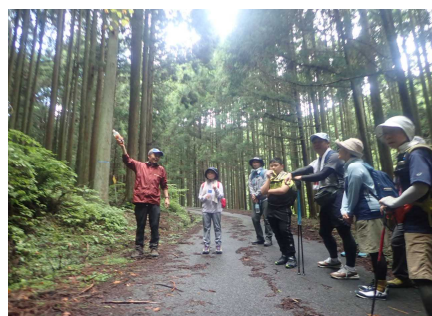
薬草植物観察のようす②