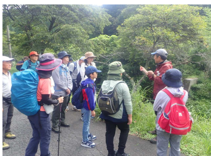
薬草植物観察のようす①