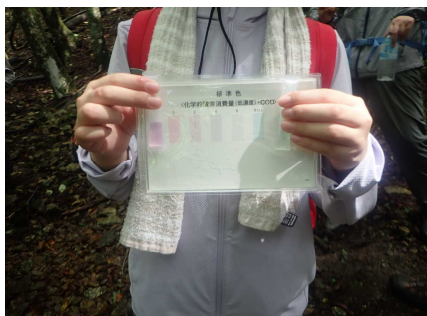
水質調査のようす②