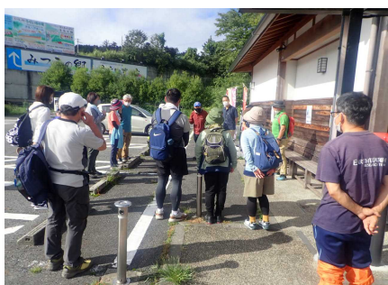
オリエンテーションのようす