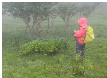
薬草植物観察のようす④