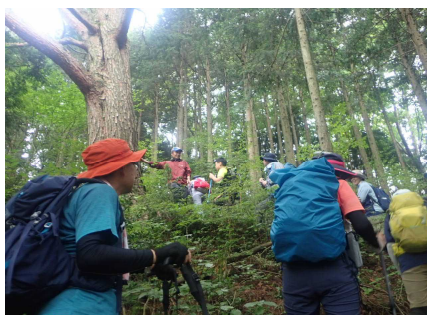
三峰山登山のようす