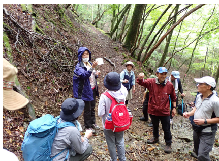
水質調査のようす①