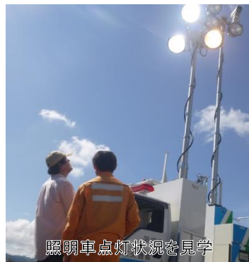
照明車点灯状況を見学