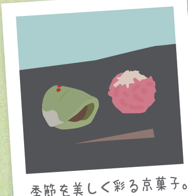
季節を美しく彩る京菓子。