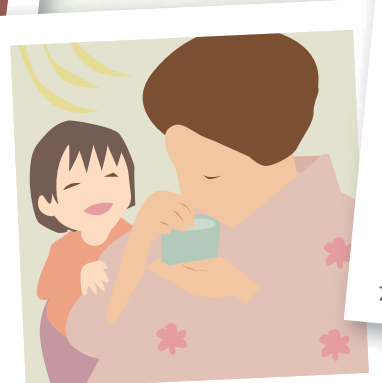
香木ってどんな香り？