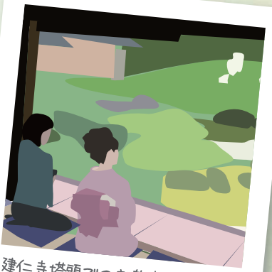
建仁寺塔頭でのお茶席、お香席で過ごすゆったりとした時間。