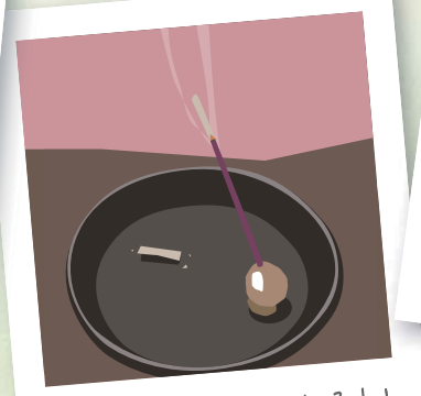
四季のテーブルコーディネート