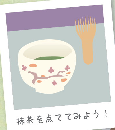
抹茶を点ててみよう！