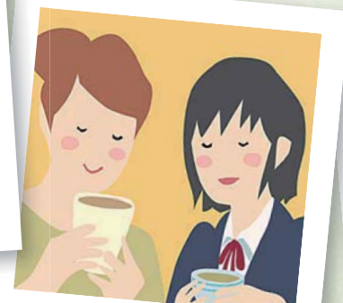
茶葉をブレンドして、自分だけのオリジナルのお茶を作ろう！