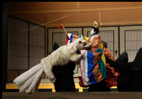
【玉藻前曦袂「神泉苑の段」】 たまものまえあさひのたもと しんぜんえんのだん