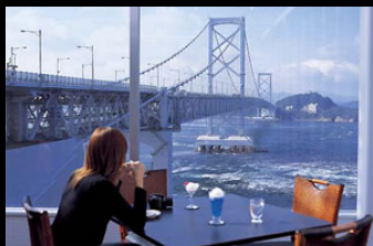
【展望レストラン うずの丘】