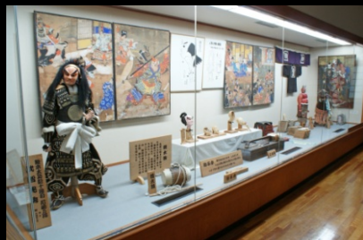
【中西館長の解説】 淡路人形浄瑠璃の歴史・ 人形の解説等