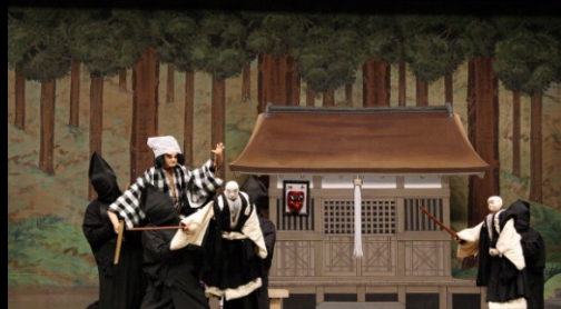
【奥州秀衡有鬘塚「鞍馬山の段」】 おうしゅうひでひらうはつのはなむこ くらまやまのだん

出発日：平成24年11月1日(木) 集合場所：大阪梅田プラザモータープール茶屋町駐車場 (裏面地図でご確認下さい。) 集合時間：午前9時