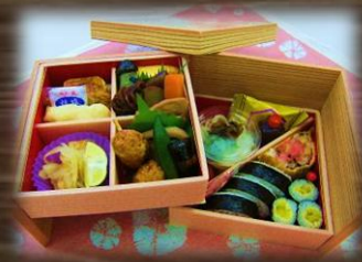
ゆきんばこ 遊山箱風弁当