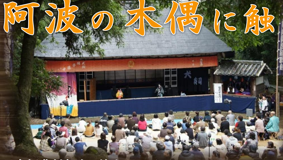
犬飼農村舞台と襖カラクリ