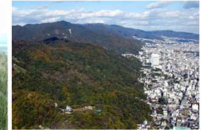
住宅に近い六甲山