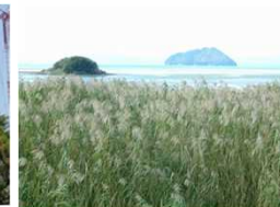
琵琶湖湖岸の葦