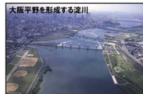
大阪平野を形成する淀川