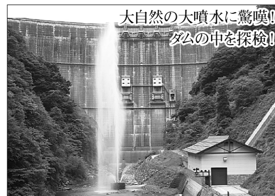
大自然の大噴水に驚嘆! ダムの中を探検!