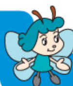
九頭竜ダムキャラクター 「もこ」