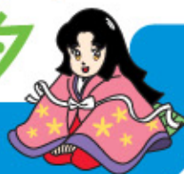
真名川ダムキャラクター 「麻那姫」