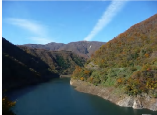
真名川ダム上流部