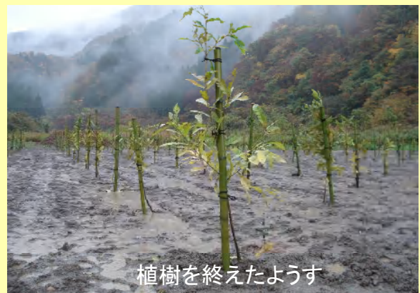
植樹を終えたようす