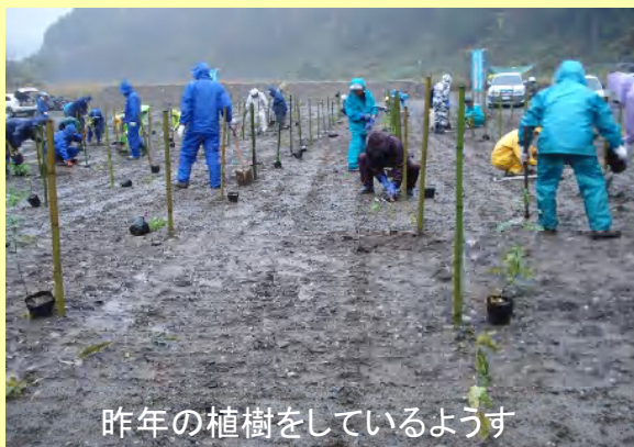
昨年の植樹をしているようす

植樹用の苗木は、NPOドラゴンリバー交流会の会員がドングリから育てたもので、当日はこの苗木をお集まりの皆さんで植樹します。