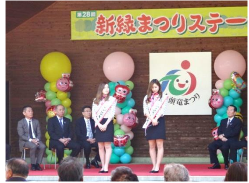
ふるさと交流大使