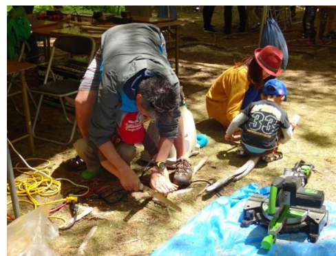
九頭竜自然楽校の流木アート教室