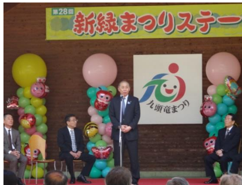
開催式典(大野市長のあいさつ)

また、協働出店された九頭竜自然楽校の方々による流木アート教室は、子どもからお年寄りまで年代を問わず多くの参加者が集まりました。