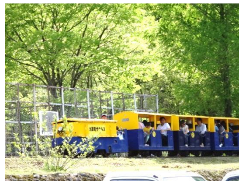
トロッコ列車乗車体験