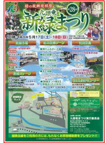
新緑まつりPRポスター