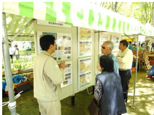
パネル内容の説明