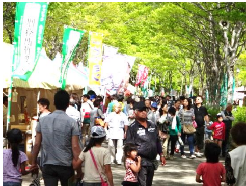
九頭竜新緑まつり風景

ステージイベントでは「ふるさと交流大使」が紹介され活発な地域間交流のネットワークづくりへの取り組みが行われました。