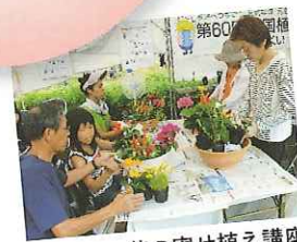
花の寄せ植え講座

花は、私たちの心に潤い を与え、生活を豊かなも のにしてくれます。身近 なところに花を植え、美 しく誇りの持てる ふるさとをつくり ましょう。