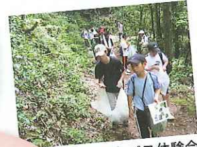
フットパス体験会