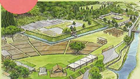
式典会場 イメージ