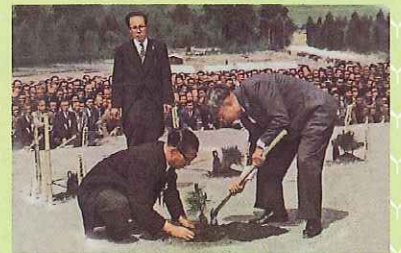
天皇家のお手植え(第13回大会)

福井県での開催は、昭和37年の第13回大会以来47年ぶり2回目となり、60回という節目の大会になります。