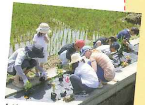
クリーンアップ&フラワー大作戦