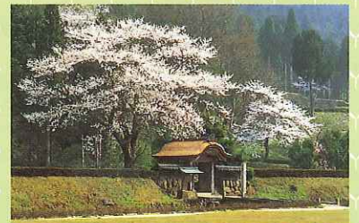
一乗谷朝倉氏遺跡「唐門」

県民の豊かな暮らしを支えてくれる自然の恵みや、自然の厳しさを再認識するとともに、多様な機能をもたらす福井の元気な森林づくりや、花木や緑にあふれ美しく誇りの持てる元気なふるさとづくりを行い、未来へ引き継いでいきます。