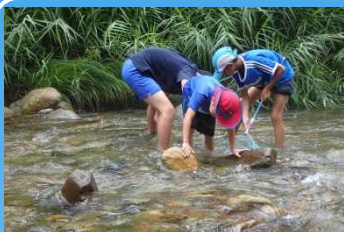
石をひっくり返して虫さがし

参加した子供たちには、水生生物の観察をおして水質や生態系のバランスについて学習していただき、「夏休みの自由研究成果になる」と喜ばれました。