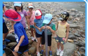
透視度計で透明度を測定