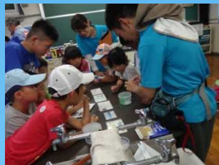
パックテストで水質測定