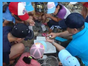
捕まえた虫の名前調べ