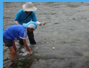
ピンポン球で流速を測定