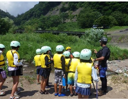
水難事故防止のための安全な川遊び