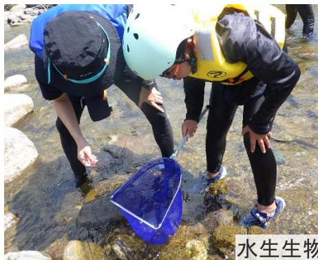
水生生物採取の様子