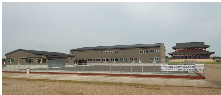
殿院地区 加工・原寸場、資材保管庫