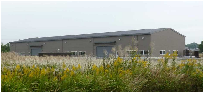
北方地区 木材保管庫