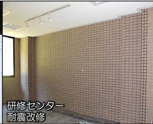
研修センター 耐震改修