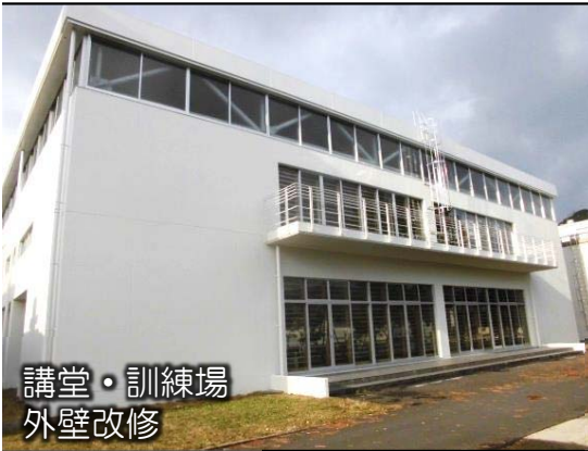
講堂・訓練場 外壁改修