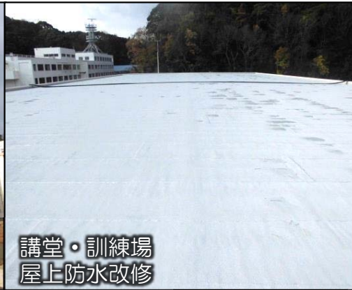
講堂・訓練場 屋上防水改修