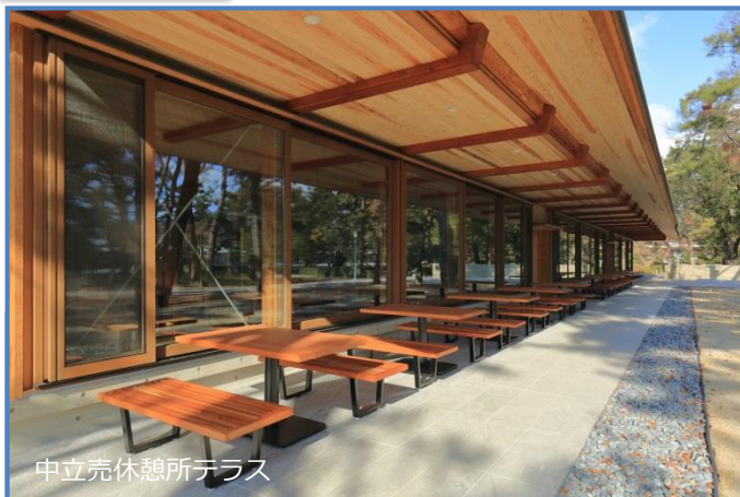
中立売休憩所テラス