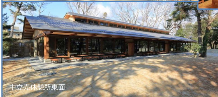
中立売休憩所東面