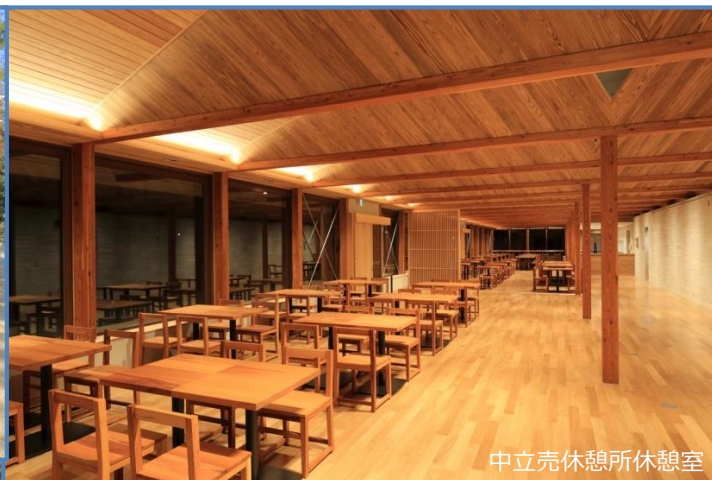
中立売休憩所休憩室