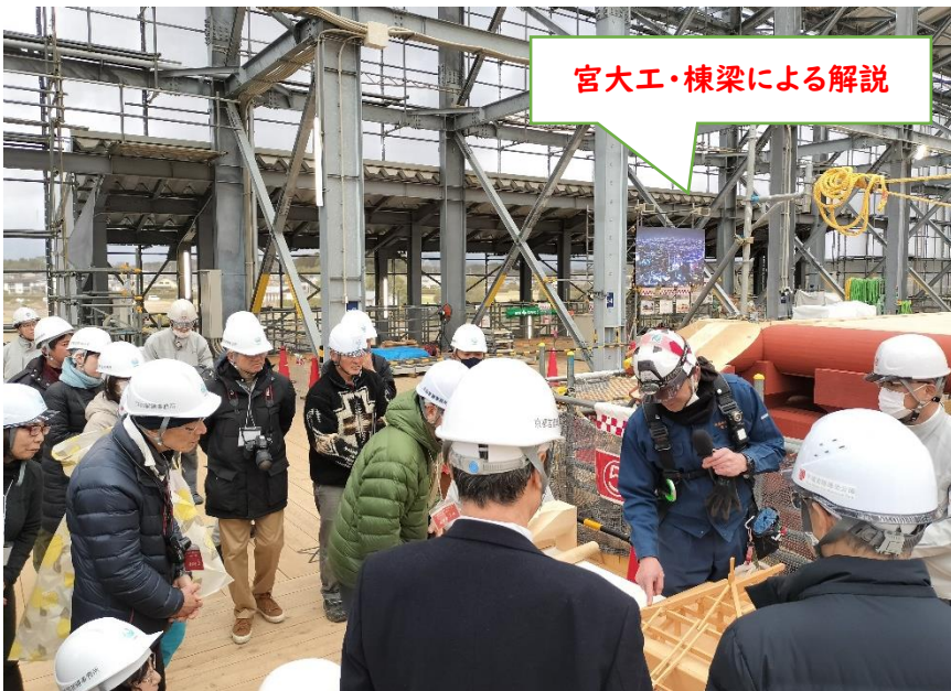
宮大工・棟梁による解説