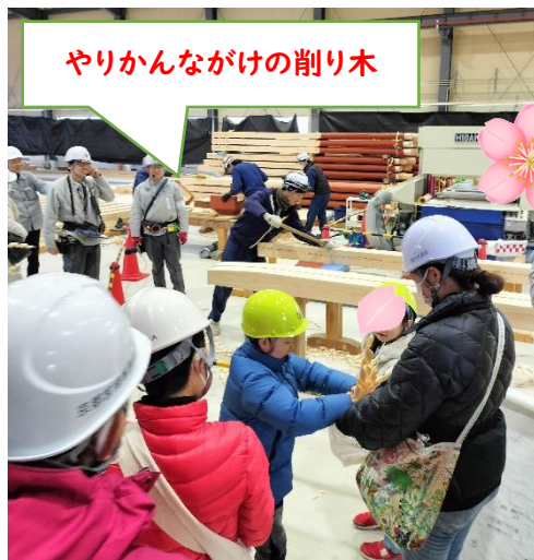
やりかんながけの削り木