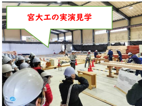
宮大工の実演見学