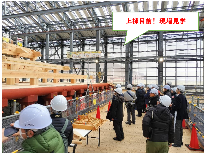
上棟目前！現場見学