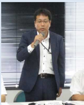
福知山河川国道事務所長挨拶

日時: 令和元年7月25(木)13:30~17:05 場所: 京都国道事務所 5階 会議室 出席者: 京都国道事務所、福知山河川国道事務所、京都府、京都市、京都府下25市町村、西日本高速道路(株)、京都府道路公社、(一財)京都技術サポートセンター