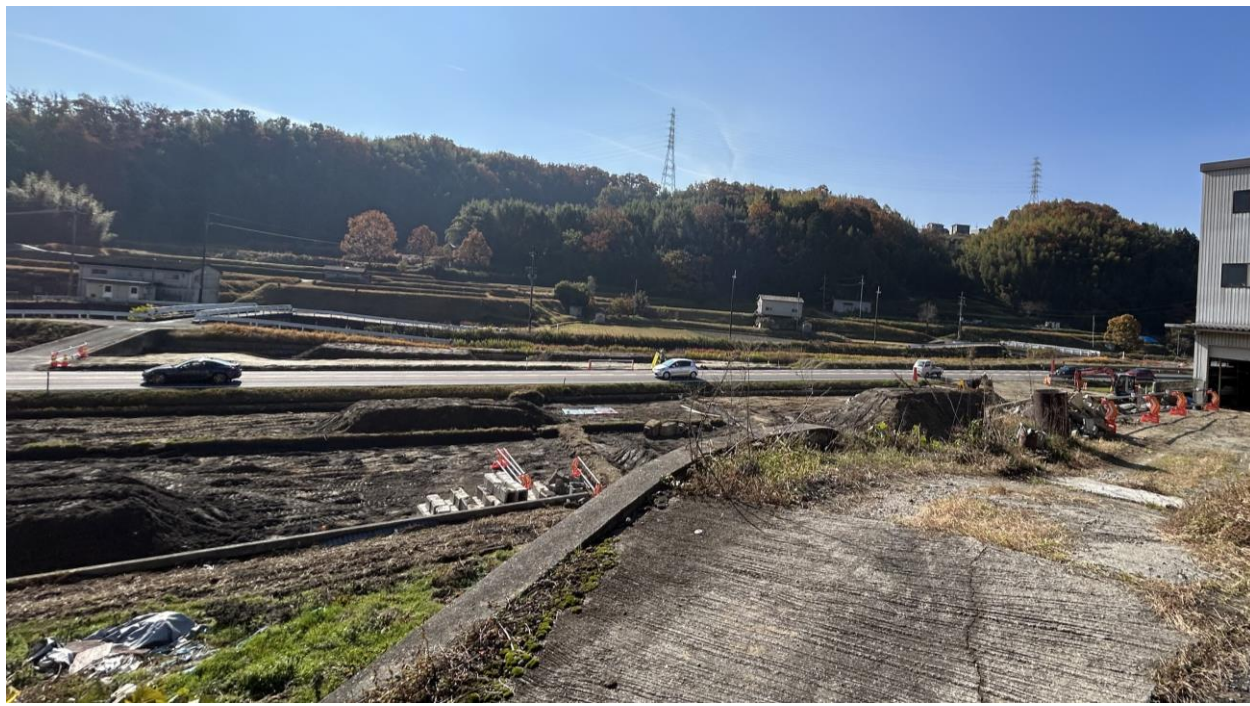
↑今後、橋梁の下部工事を施工していきます