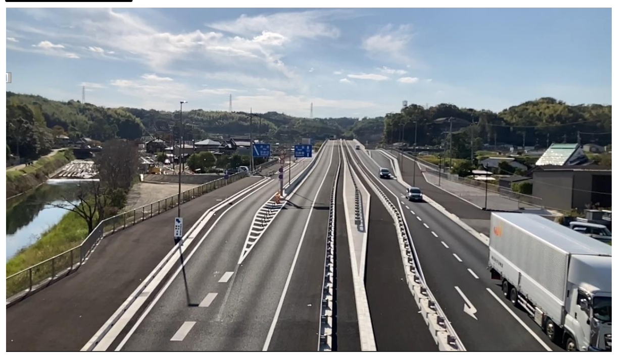
↑令和5年3月31日に乾谷地区を暫定2車線で開通しました。