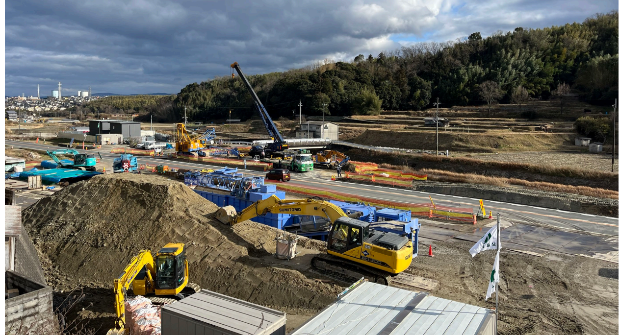
↑国道163号を跨ぐ橋の下部工を進めています