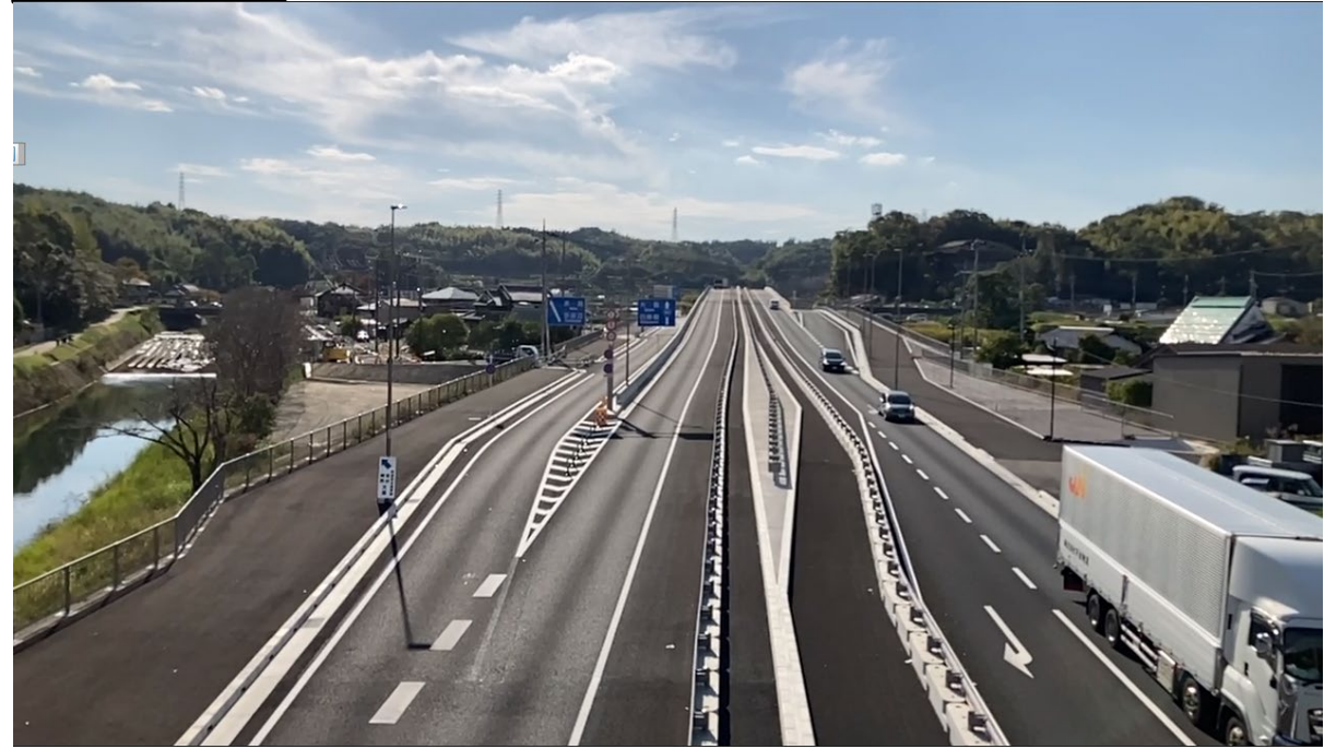
↑令和5年3月31日に乾谷地区を暫定2車線で開通しました。