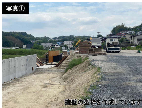
擁壁の型枠を作成しています