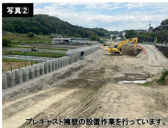
プレキャスト擁壁の設置作業を行っています。