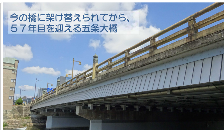
今の橋に架け替えられてから、57年目を迎える五条大橋