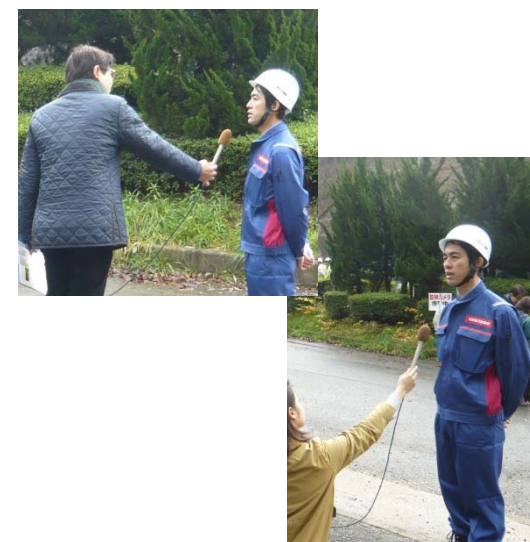
テレビ局(2社)からの取材も受けました！