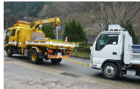
作業車両での牽引訓練！！

* 京都国道事務所では、12月16日（水）に降雪により通行に支障が生じないように、立ち往生・放置した車両の移動訓練を実施しました。 * これからも国道を利用する皆様に安心して通行していただけるよう努めて参ります。