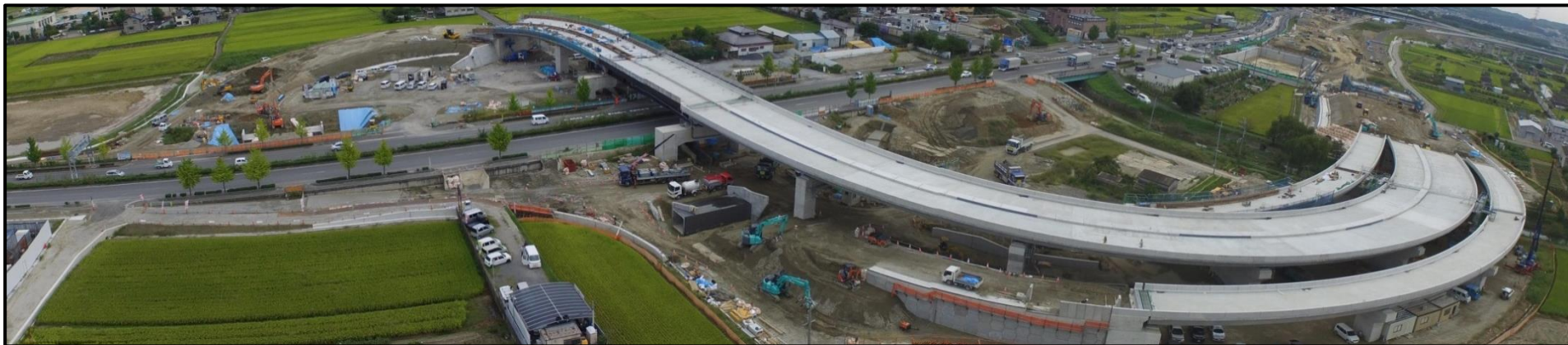
城陽 I C 工事現場（航空写真）