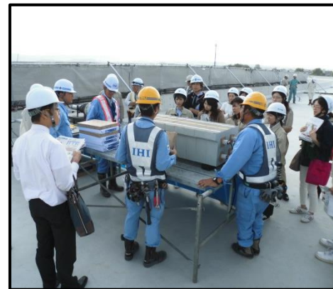
工事業者による説明風景（IHI・ピーエス三菱）