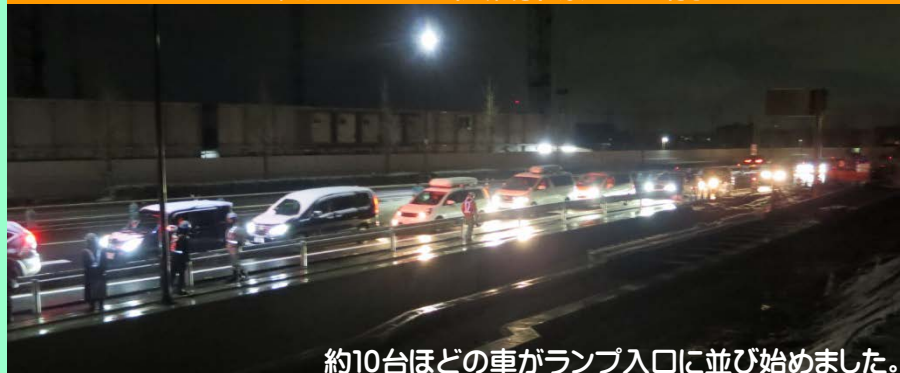
約10台ほどの車がランプ入口に並び始めました。