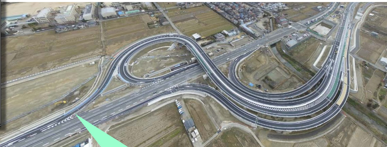
●2月11日 供用開始直前