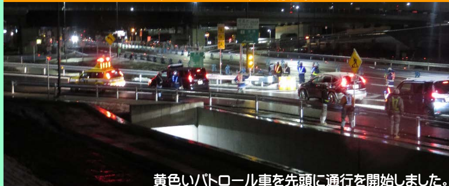
黄色いパトロール車を先頭に通行を開始しました。