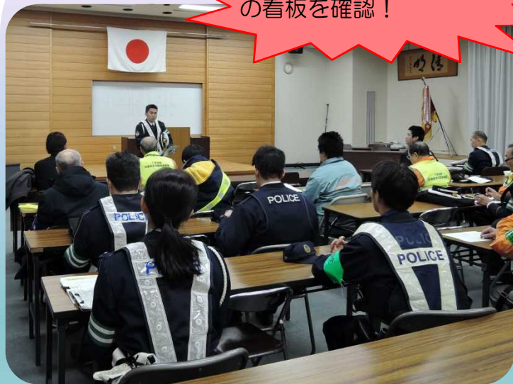
下京警察署での出陣式