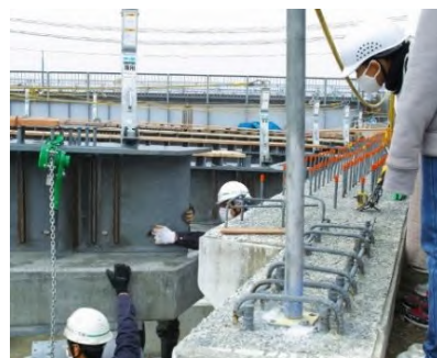
桁架設を間近で見学②