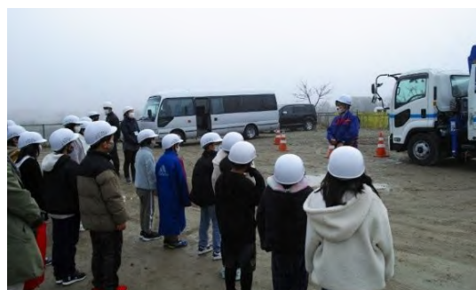
ヘルメットを被って現場を見学