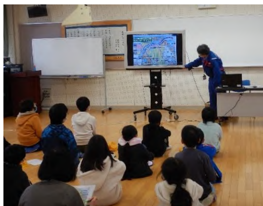
橋の役割や橋の特徴を勉強

■学校で事業の目的や橋の役割、若宮橋（プレビーム桁）の特徴などを勉強し、国道9号若宮橋架替事業の工事現場にて、実際に桁がかかるところを見学しました。