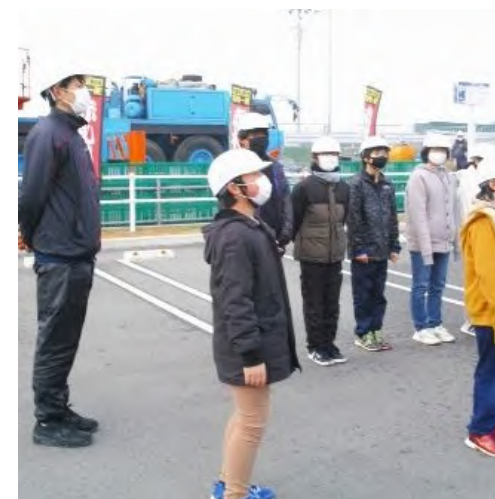
現場の皆さんに今日のお礼と感想