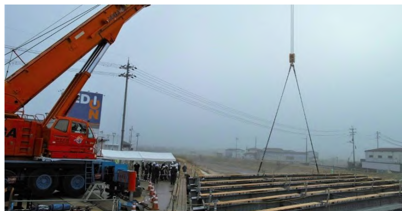
桁架設を間近で見学①