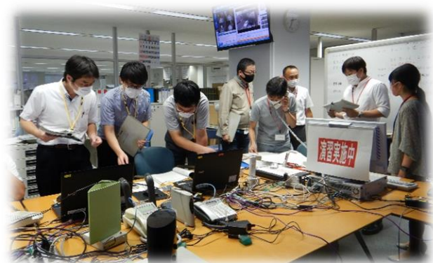
災害対策室での初期対応

演習には、事務所職員に加え、防災エキスパートにも来て頂き、計34名が参加しました。