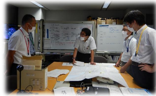
対策部長への引継