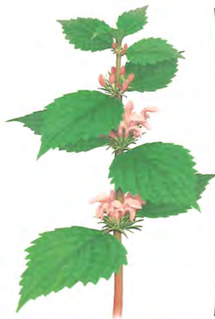
オドリコソウ (おどり子草)

この場合の「おどり子」は、カサをかぶった日本のおどり子。白とピンクの花が、花ガサに見えるかな？ 山や林の道ばたにはえているよ。