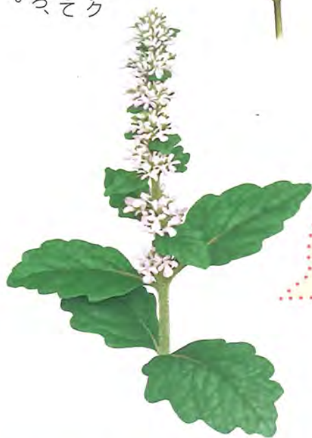
ジュウニヒトエ (十二ひとえ)

スギの葉こそつくりなスギナは、ツクシの兄弟。地下の「くき」でつながっているんだ。ツクシが枯れ始めると、日当たりのよい草地に顔を出すよ。