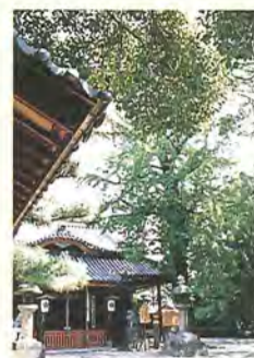
⑩ 佐太天神宮(守口市) みごとに紅葉する拝殿横のイチョウ。

十月八日は「木の日」。十と八で木という字になるからですが、ご存じでしたか? 「緑立つ道」の周辺には、公園あり、水辺の緑あり、巨樹・古木あり……、と美しい樹木たちがいっぱい。「大阪みどりの百選」にも選