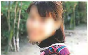
( )さんプロフィール

もちろん、大阪と京都を結ぶ主要道路としての役割にも、とても期待しています。大阪市内に住んでいる祖母をたずねて、家族と一緒によく車で国道1号線を走りますが、よくあの渋滞に巻き込まれてしまつて…。短大時代にも「緑立つ道18号」で紹介のあった国道307号線の渋滞に悩まされ、バスを使わず、125ccバイクの免許を取ったという経緯があります。だから、自然の魅力にあふれ、その上、渋滞も解消してくれる…そんな道路になるととても期待しているんです。