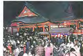
⑧ 成田不動尊(寝屋川市) 大晦日から元旦にかけて、毎年多くの人々で賑わいます。

いよいよ1999年も残りあとわずか。今回は読者の皆さんからお葉書でご紹介いただいた「初詣・初日の出スポット」をご紹介します。「初詣は蹉跎神社。うっそうとした杜の中、ご神灯で照らし出された石段を気持ちを引き締めて登ります。(枚方市/匿名希望)」、「初日の出は、やっぱり交野市倉治・交野山