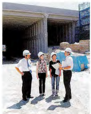
1 長尾東地区 後ろに見える大きな空間が「緑立つ道」。現在、開削工事が着々と進んでいます。