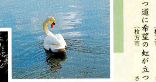
打上川治水緑地 水面の水鳥を見ていると、暑さを一時忘れさせてくれます。池の外周は絶好の散歩道です。(枚方市 さん)

山田池 孫と一緒に山田池に行ったところ、蓮の花が美しかったので写してきました。(寝屋川市 さん)