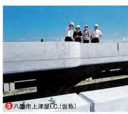
3 八幡市上津屋I.C.(仮称) 完成間近の上津屋高架橋の上にて。右の写真は、上津屋I.C.付近を上空から写したもの(平成14年7月撮影)。

でも効果が期待できますね。 野田 環境にやさしい道になるわけですね。“人”にはどうですか。例えばバリアフリーの問題なども気になります。