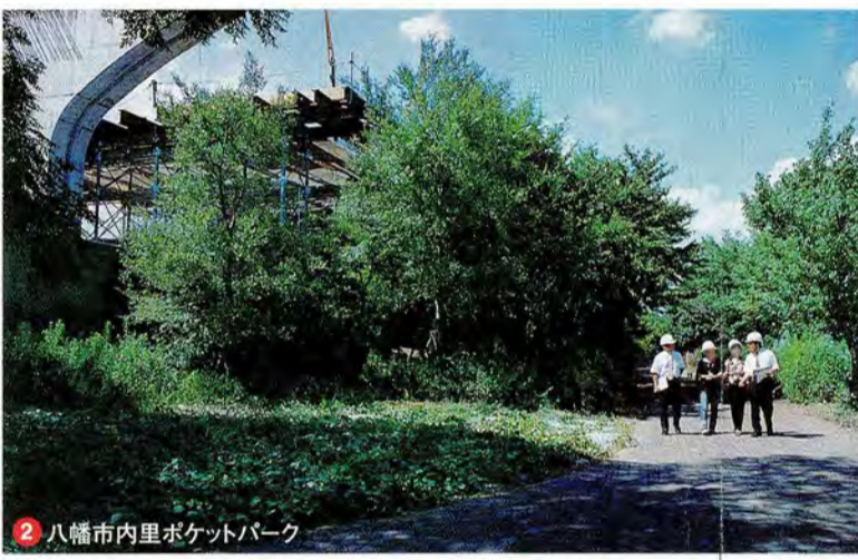
2 八幡市内里ポケットパーク 環境施設帯のモデル地区だけあって、緑あふれる、爽やかな空間。植樹プランなどに話が弾みました。