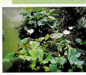
山田池 孫と一緒に山田池に行ったところ、蓮の花が美しかったので写してきました。(寝屋川市 さん)