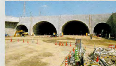
4連めがねトンネルが姿を現しました。