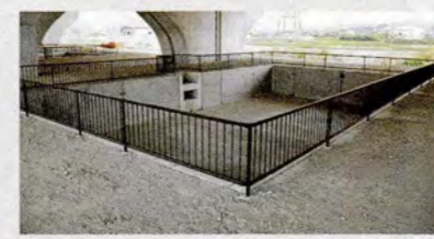
寝屋川市寝屋付近