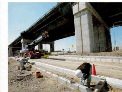
●緑石を人力で設置しています。第二京阪全線でなんと30万個以上!(門真市三ツ島付近)