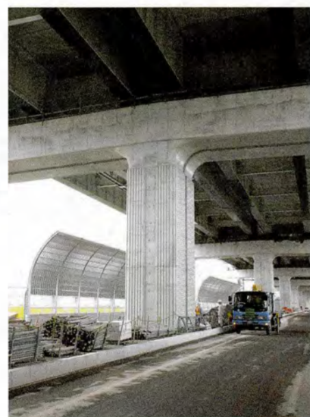
●遮音壁・舗装工事が始まっています。(四条畷市砂付近)