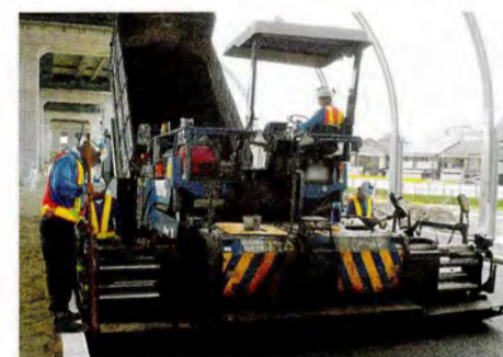
●一般部の舗装工事が進んでいます。(門真市北島付近)