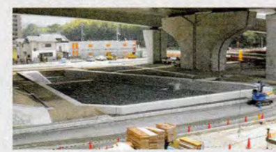
寝屋川市寝屋付近

高架下等の用地を利用して、道路に降った雨水が近辺の川や下水道などへ一気に流れるのを防ぐために、水を一時的に溜めておける調整池を設置しています。