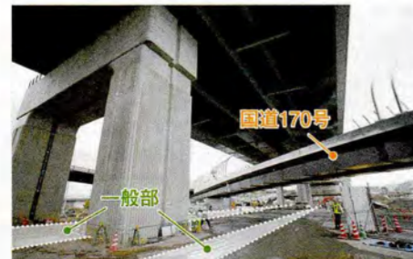
●主要な交差道路の整備も進んでおり、国道170号も高架に切り替わります。1番上が自動車専用部、まん中が国道170号、下が一般部。(寝屋川市楠根付近)