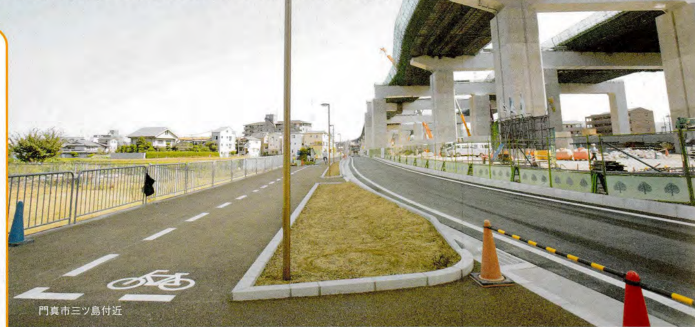
門真市三ツ島付近