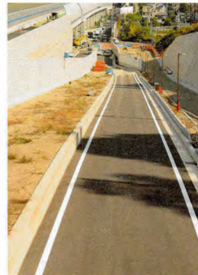
●既に開通している区間と工事中区間の境目。(枚方市津田東町付近)