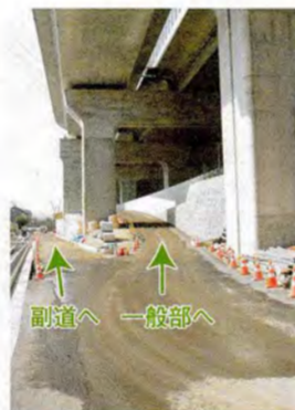
●右へ上がると一般部へと合流します。(交野市倉治付近)