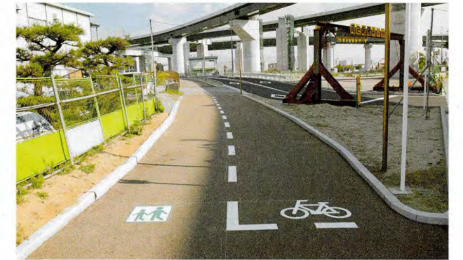
●通行区分マーク(門真市種島付近)

自転車や歩行者等の安全を考慮して、約4mの幅があります。自転車歩行者道の下には、電線共同溝(電話線や電気線などを収納)が埋設され、電柱がなくサイクリングや散歩する際に見渡しが良くなります。また、自転車マーク・歩道マークを表示し区別しているので通行も安心です。外側は歩行者や車いすなど、内側は自転車が通行します。