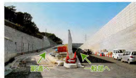
●右が一般部の本線、左へ副道が分かれています。(枚方市津田東町付近)

一般部の両脇には生活道路と一般部をつなぐ道路があります。生活道路同士を結ぶことで地域のネットワークを形成するとともに、多くの生活道路を副道に集約することで一般部のスムーズな交通を確保し、沿線地域の方も便利にご利用いただけます。