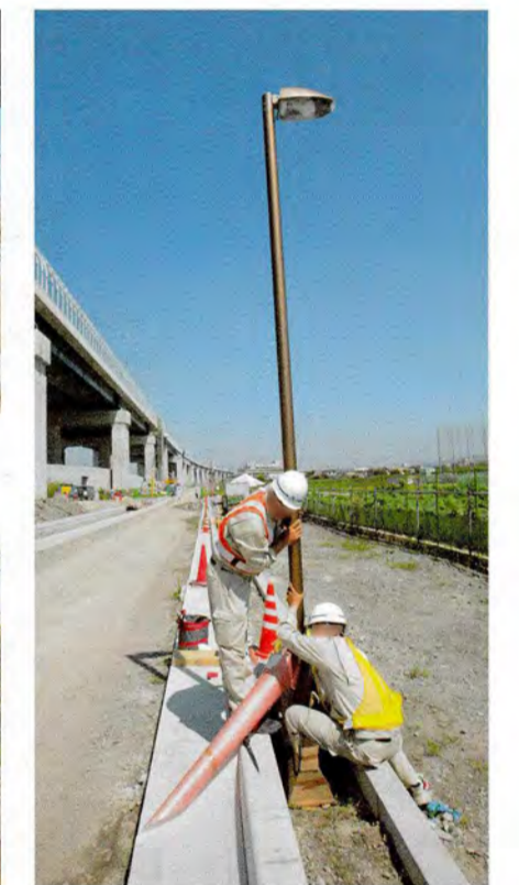
●照明を設置しています。1つ1つ人力で進めています。(門真市三ツ島付近)