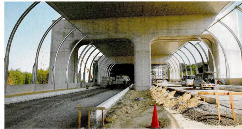
●遮音壁・舗装工事が始まっています。(交野市東倉治付近)