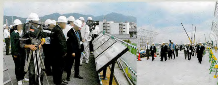
寝屋川市 小路トンネル(仮称)の上