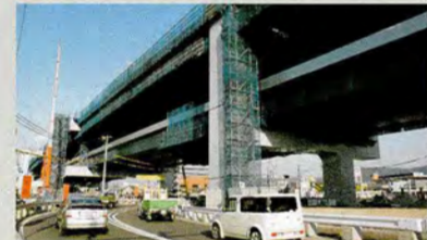
一般部の橋げたが完成しました。