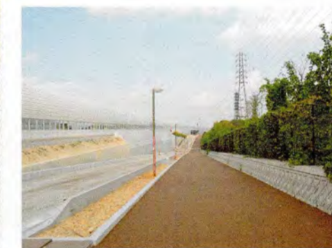
●電柱がなく見渡しが良い自転車歩行者道が続きます。(寝屋川公園付近)