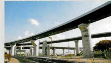
周辺道路が着々と整備されてきました。