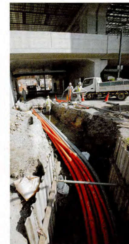
●電話線や電気線などを埋設しています。(門真市上馬伏付近)