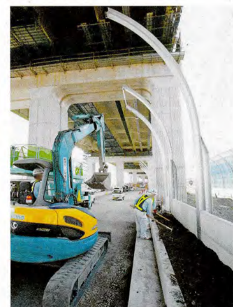
●狭小な箇所では人力作業も行いながら進めています。(門真市三ツ島付近)