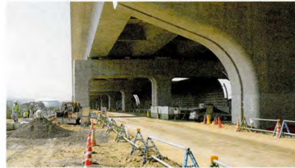
●道路の形が見え始めています。(交野市青山付近)

一般部は地域の幹線道路としての役割を果たすとともに、国道163号や国道170号などの主要道路とインターチェンジとの連絡をします。平成22年3月の全線開通を目指しています。沿線地域の生活環境にも配慮しながら、高架区間では限られたスペースの中でたくさんの工事を進めています。