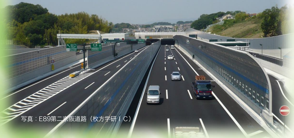
写真：E89第二京阪道路 (枚方学研IC)