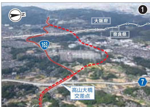
高山大橋交差点付近より清滝生駒トンネル方面を望む (平成27年10月撮影)