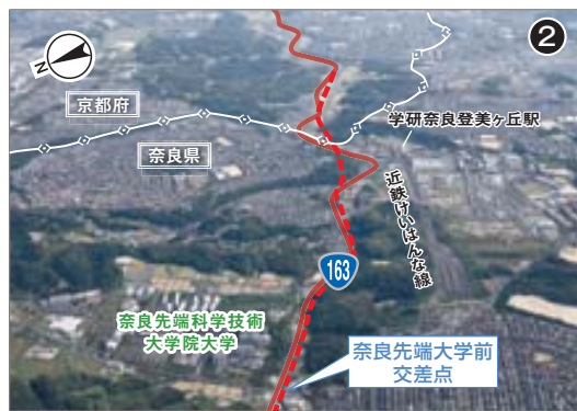
奈良先端大学前交差点付近より京都方面を望む (平成27年10月撮影)