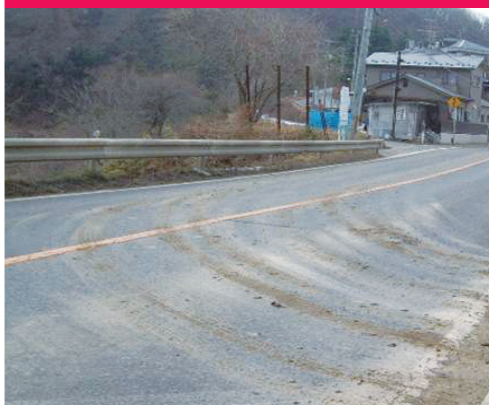
路面の汚れ(油・土砂)