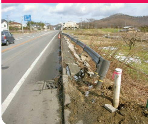
ガードレール・標識等の損傷