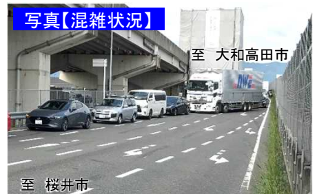
新堂ランプ交差点の混雑状況 令和3年7月13日(火)