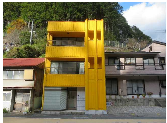
伯母峯峠道路建設監督官連絡所 (奈良県吉野郡上北山村河合 666-7)