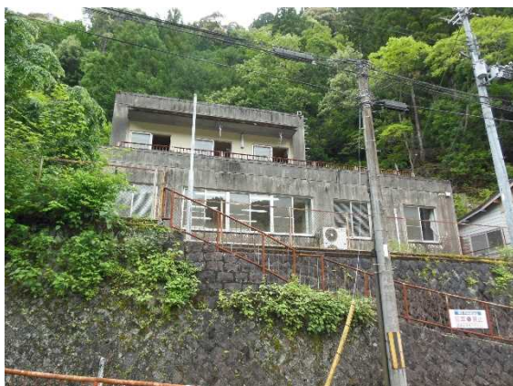
十津川道路建設監督官連絡所 (奈良県吉野郡十津川村武蔵 10-2)