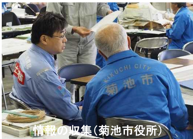
情報の収集(菊池市役所)