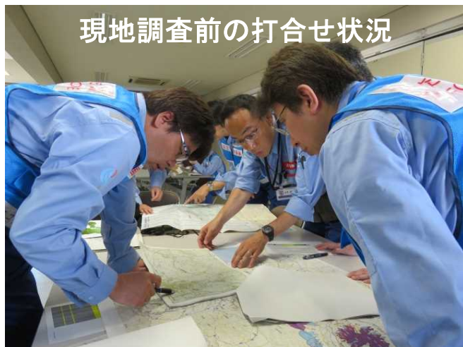
現地調査前の打合せ状況