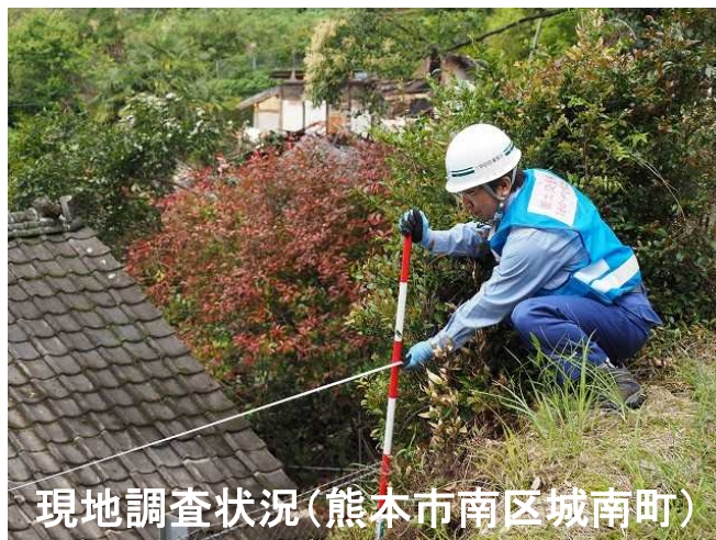
現地調査状況(熊本市南区城南町)