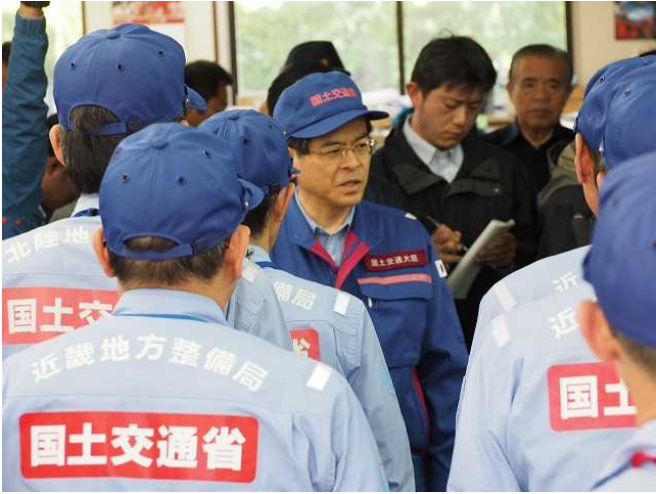
【南阿蘇村役場にて近畿TEC-FORCE 4班を激励】