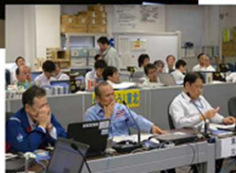
地方整備局等 災害対策本部