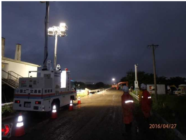
照明車の稼働状況 (野田地区 緑川右岸 9k150地点)