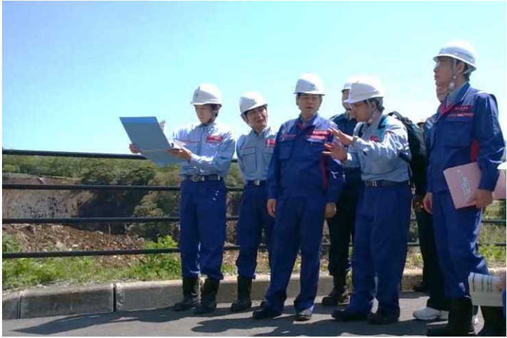
【南阿蘇村の阿蘇大橋視察状況】