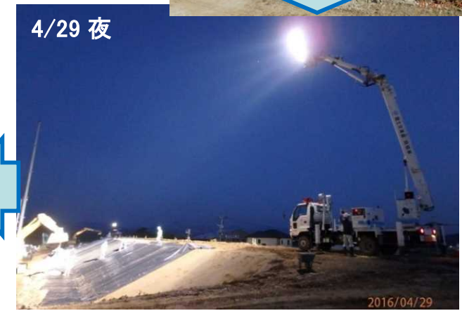
照明車の稼働状況 (城南町高地地区 緑川左岸 10k900地点)