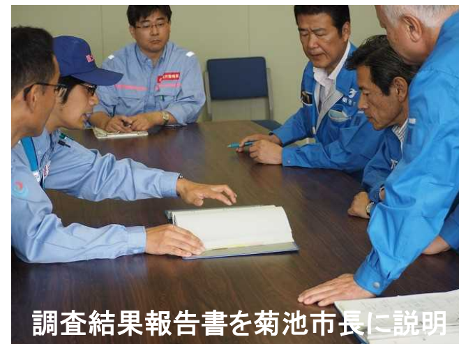
現地調査状況(熊本市南区城南町)