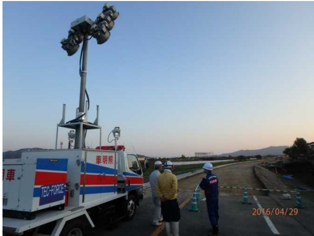
照明車の設置状況 (野田地区 緑川右岸 8k975地点)