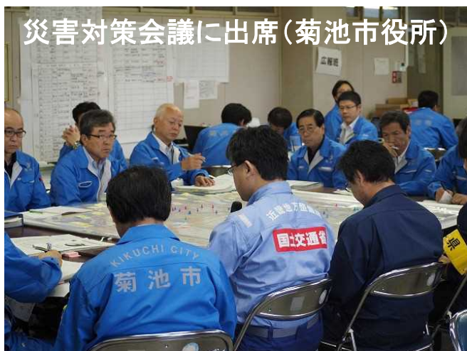
災害対策会議に出席(菊池市役所)