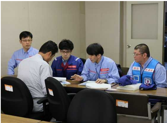
菊池市に報告書の説明・提出