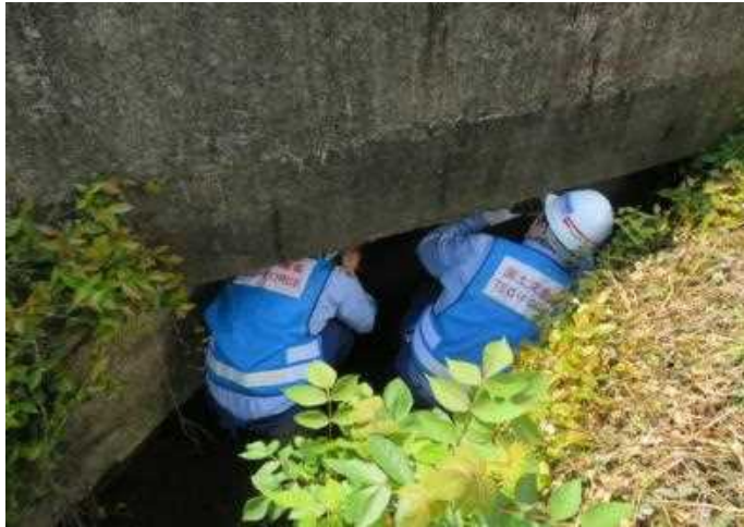
橋梁の現地調査状況(菊池市内)