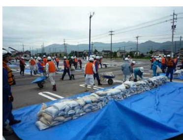
水防訓練(土のう作成)