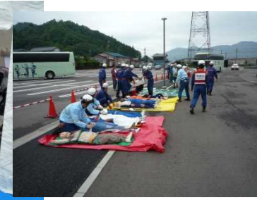
集団災害訓練(救助活動)