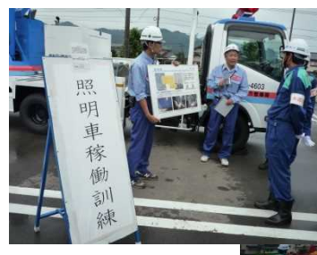
照明車稼働訓練(国土交通省)