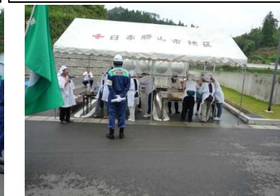
非常食の応急炊飯