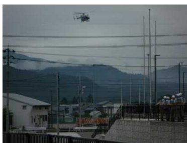
防災ヘリ救助訓練

実施日時 : 平成29年6月25日(日) 実施場所 : 勝山市(ジオアリーナ、勝山市役所、各避難所など) 主催 : 勝山市