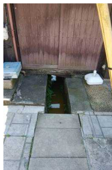
今も現役の背割り水路