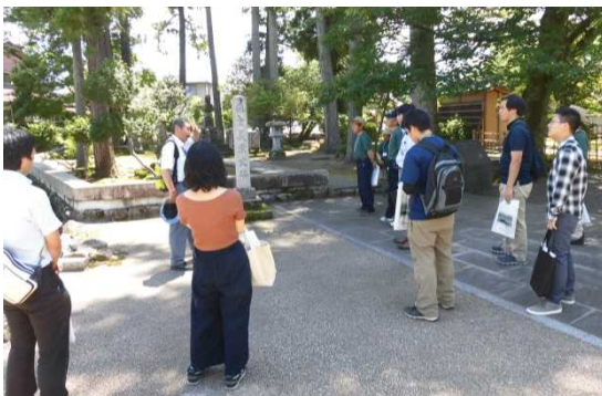
歴史の会の方の説明を聞く参加者

実施日時 : 平成29年7月7日(金) 実施場所 : 平成大野屋(大野市)と大野市街地 主催 : 大野市 後援 : 国土交通省 福井県 (協力:G空間EXPO運営協議会) 参加者数 : 51名